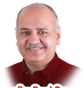
मनीष सिसोदिया MANISH SISODIA